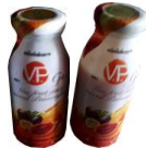
น้ำฟักข้าวสเตอไรไรส์