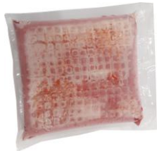
เนื้อเยื่อสีแดง-สีเหลืองแช่แข็ง