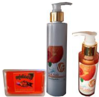
สบู่ฟักข้าวก้อน-เหลว